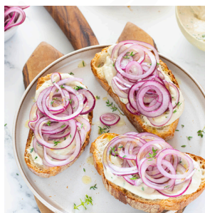
04 BRUSCHETTA AUTUNNO