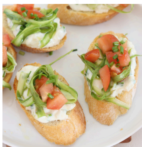
02 BRUSCHETTA PRIMAVERA