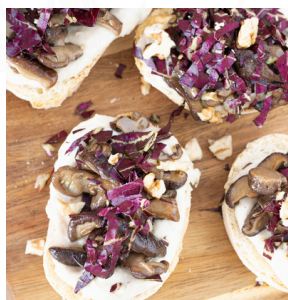
05 BRUSCHETTA INVERNO