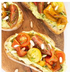
03 BRUSCHETTA ESTATE